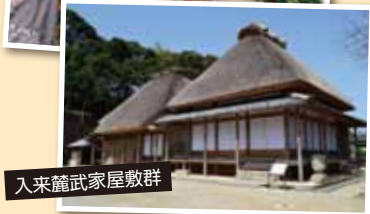
入来籠武家屋敷群

※運輸機関のダイヤ改正、各地の道路状況により行程の変更になる場合がございます。※お申込みは受付順になります。また満席になり次第お申込み受付を終了いたします。※ご出発当日はAコースは「みどりの窓口前」10:00~10:30まで、Bコースは「鹿児島中央駅西口バスターミナル」にて8:50~9:20まで受付を行います。※特急A列車で行こう、貸切バスのお席は受付順にて配席させていただきます。他のお客様と相席になる場合がございます。※利用バス会社はJR九州バスとなります。※確定情報を記載するご旅行案内及び旅行日程表は、この書面をもって替えさせていただきます。※今後の商品造成の参考のため簡単なアンケートにご協力ください。