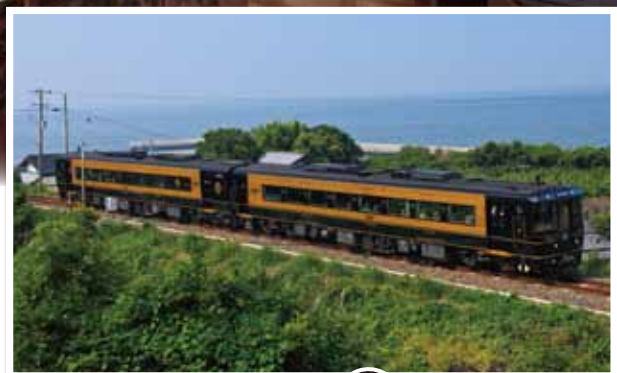
※写真はすべてイメージです。