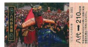
【八代妙見祭 (八代市)】