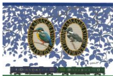
【記念乗車券台紙 (裏)】