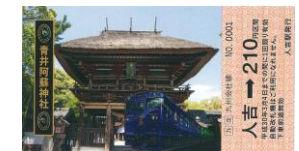
【青井阿蘇神社 (人吉市)】