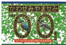
【記念乗車券台紙 (表)】