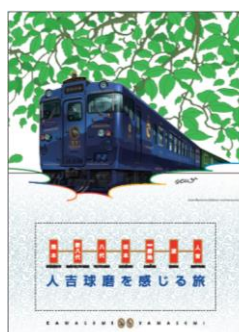
【記念乗車券台紙 (中)】