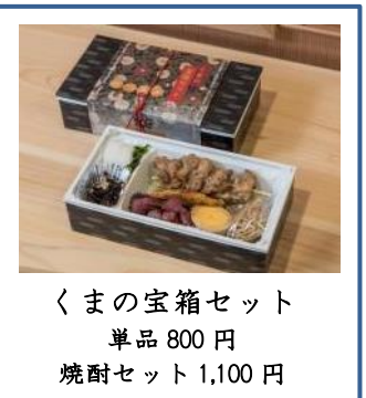
くまの宝箱セット 単品 800円 焼酎セット 1,100円