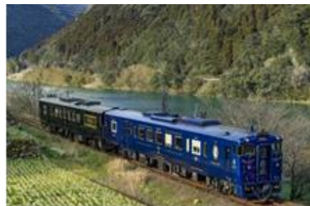
かわせみ やませみ