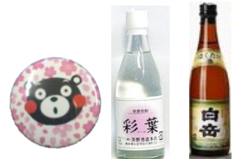
バッジと焼酎ミニボトル

お帰りのJR券を提示すると人吉駅前広場会場にて「くまモンバッジ」と「焼酎ミニボトル(1本)」を先着200名さまにプレゼントいたします。