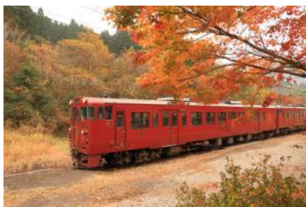
いさぶろう・しんぺい